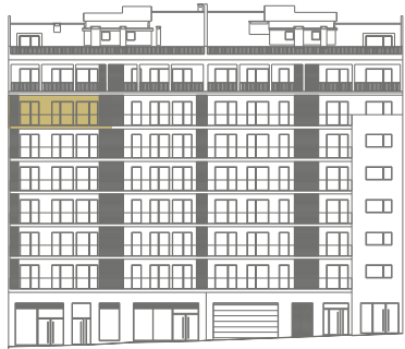
RUA D. FRANCISCO MANUEL DE MELO, 3 - LISBOA

RUA D. FRANCISCO MANUEL DE MELO, 3 E 5 - LISBOA