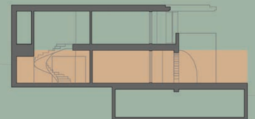
Cortes | Section