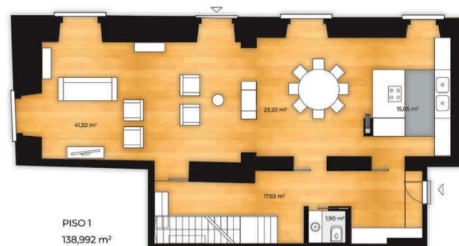
PISO 1 138,992 m 2

Todos os elementos constantes neste documento são meramente indicativos, poderão sofrer alterações e não têm carácter contratual. All elements contained in this document are merely an indication, may be altered and do not hold legally.