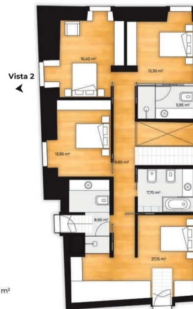
PISO 2 141,822 m 2

Plantas meramente indicativas e sem carater contratual.