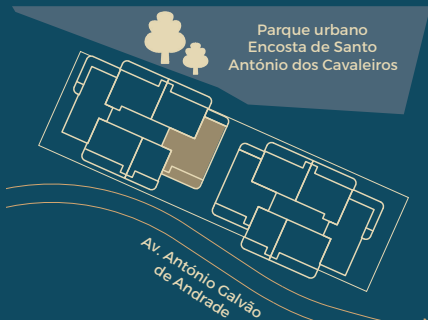
Implantação Master Plan