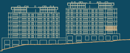
Alçado Norte North facade