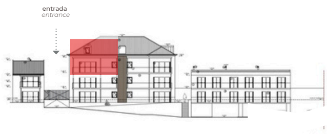
SO - Tardoz SW - Back View