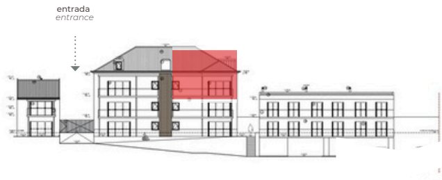
SO - Tardoz SW - Back View