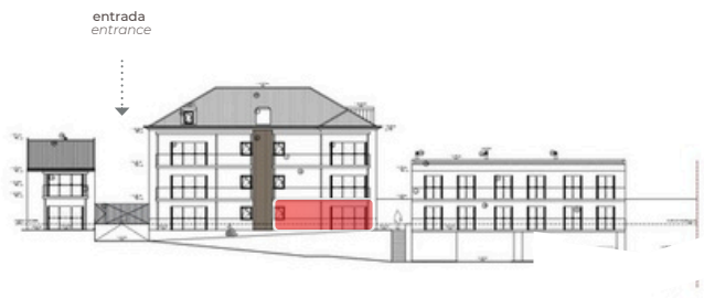
SO - Tardoz SW - Back View