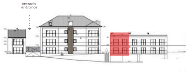
SO - Tardoz SW - Back View