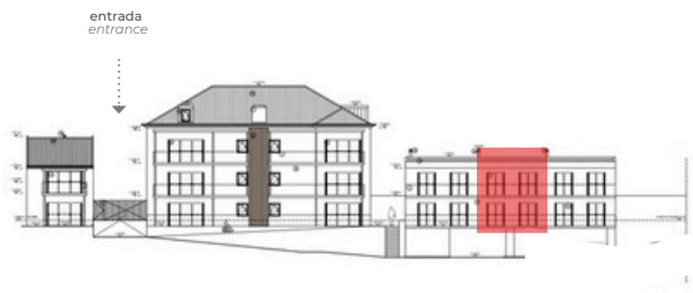
SO - Tardoz SW - Back View