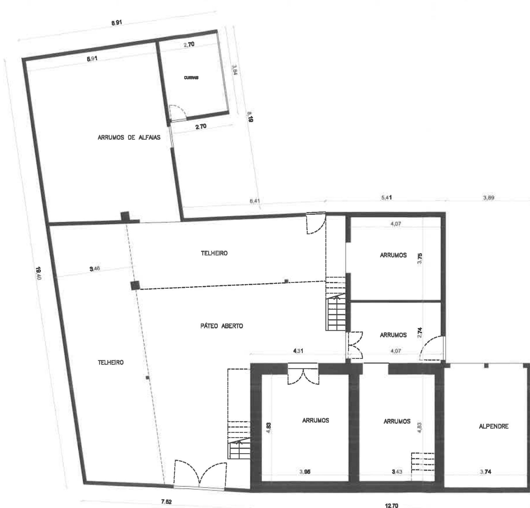
PLANTA DO R/CHÃO