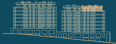
Alçado Sul South facade