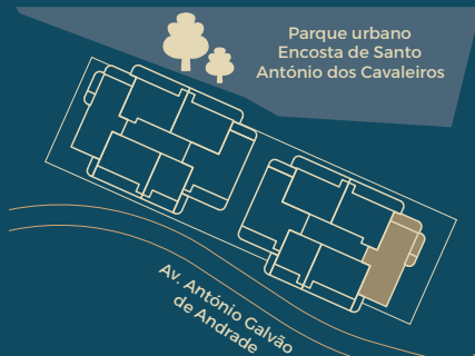
Implantação Master Plan