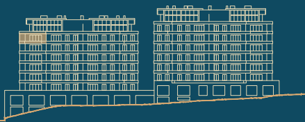
Alçado Norte North facade