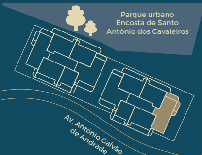
Implantação Master Plan