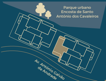
Implantação Master Plan