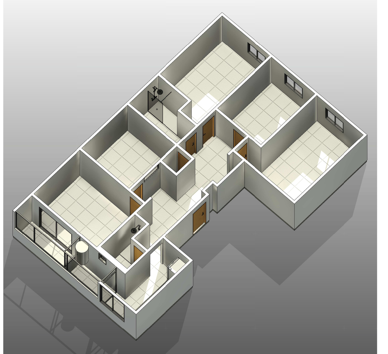
4 Perspetiva 3D - 3 ESCALA