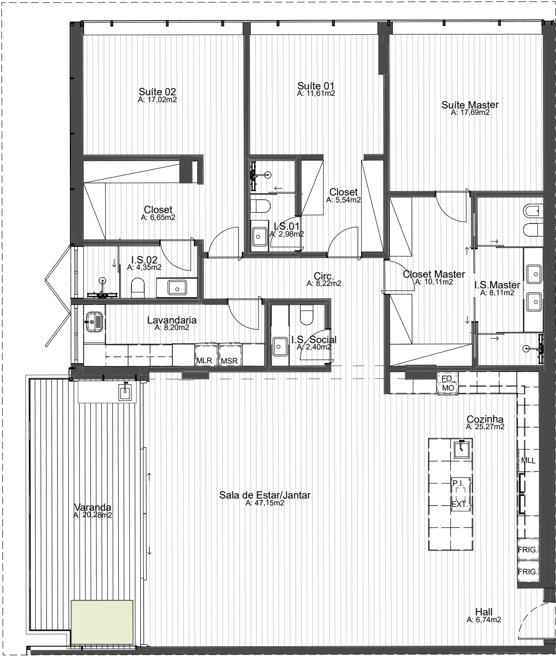
PLANTA APARTAMENTO 2D 1:100